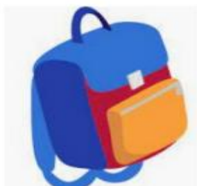
Un sac à dos pouvant contenir un grand cahier