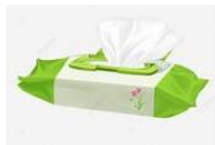
Un paquet de lingettes