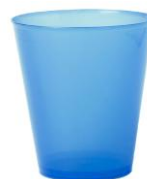
Un verre en plastique pour la classe