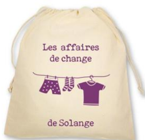
Un sac en tissu étiqueté au nom de l'enfant, avec à l'intérieur, un change complet (qui restera accroché au porte-manteau). Ce sac vous sera restitué en fin de période afin de changer de vêtements en fonction de la saison.

Toutes les affaires doivent être marquées au nom de votre enfant.