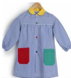
Une blouse (Commandé e par l'école)*