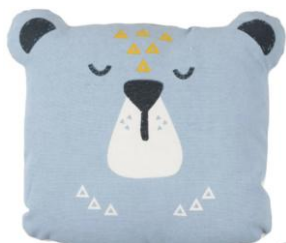
un petit coussin pour se reposer pendant le temps calme, en début d'après-midi