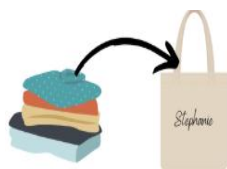
un change complet dans un sac en tissu