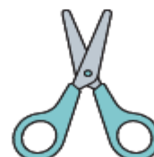
une paire de ciseaux