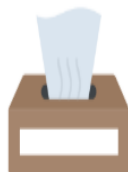
un paquet de mouchoirs